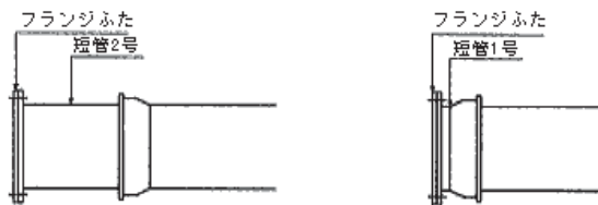
図2 呼び径1600以上の大口径管の栓止め例

栓の最大管径はK形の呼び径1500であるため、これ以上の管径では、管末部に短管1号、2号等を接続してフランジふたによる栓止めを行います。